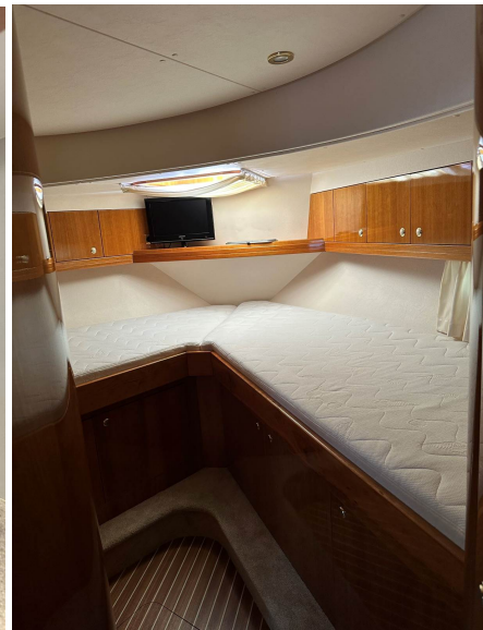
Bugkabine mit 2 Einzelbetten