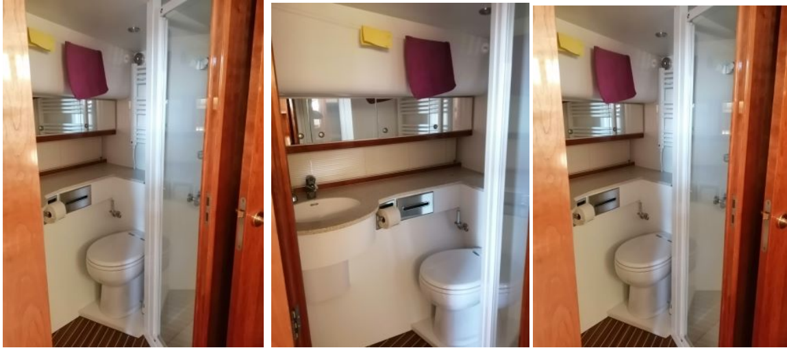
Toilette, Duschkabine und Waschbecken im Bug Bereich