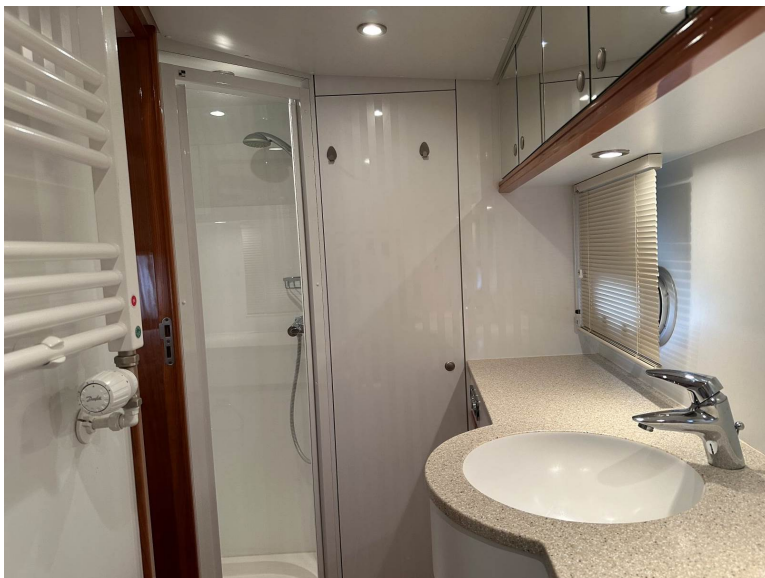
Toilette, Duschkabine u. Waschbecken bei Achterkabine