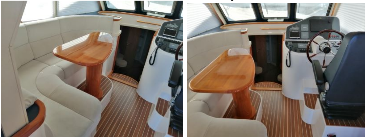
Decksalon mit Steuerstand