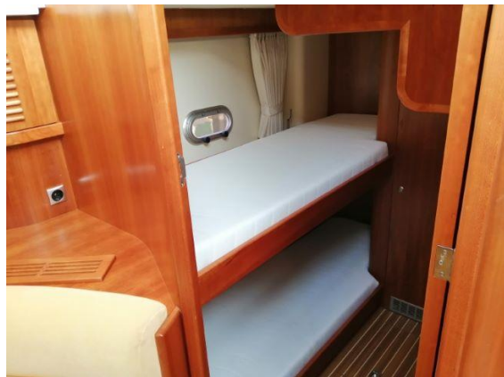
Seitenkabine mit Stockbett