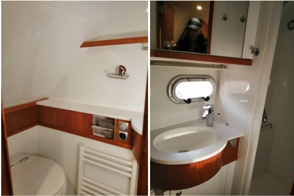
Toilette mit separater Duschkabine im Heck