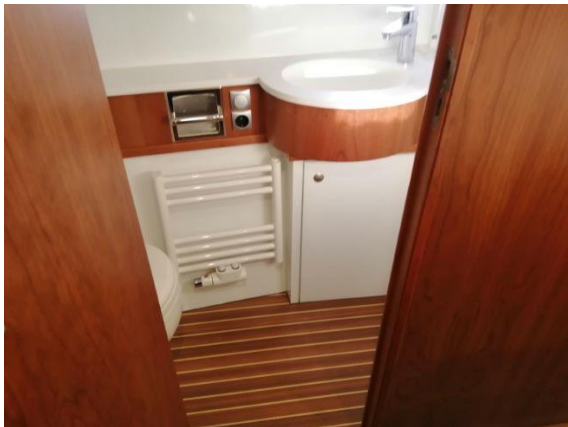
Toilette mit Dusche Achtern