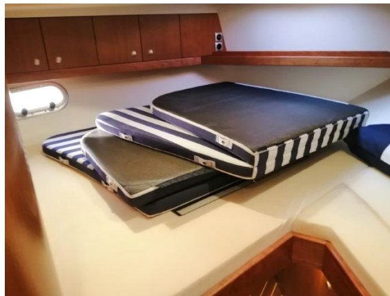
Bugkabine an Backbord befindet sich ein Doppelbett Steuerbord ein Einzelbett